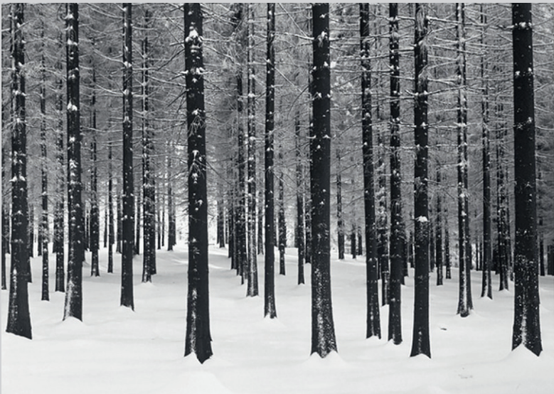
Albert Renger-Patzsch (1897 - 1966), fichten im winter 1956

Η ομάδα f.64 υποστήριξε τον ρεαλισμό. Ο πιο αντιπροσωπευτικός φωτογράφος της ομάδας ο Ansel Adams έχει κάνει και έγχρωμη φωτογραφία. Όμως στην ιστορία έμεινε το υπέροχο Α/Μ έργο του.