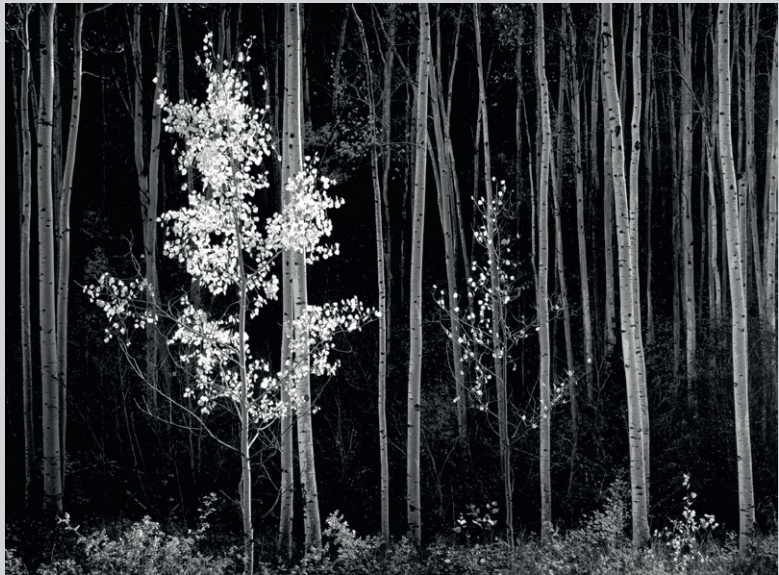
Ansel Adams (1902-1984), aspens, northern New Mexico, 1958

Η ομάδα f.64 υποστήριξε τον ρεαλισμό. Ο πιο αντιπροσωπευτικός φωτογράφος της ομάδας ο Ansel Adams έχει κάνει και έγχρωμη φωτογραφία. Όμως στην ιστορία έμεινε το υπέροχο Α/Μ έργο του.