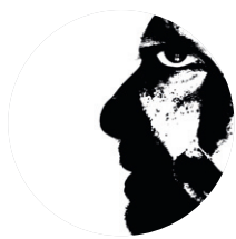
Του Τάσου Σχίζα

Αγαπώ την ασπρόμαυρη φωτογραφία για την υπερβατικότητα της! Είναι εντυπωσιακή η μεταμόρφωση οποιασδήποτε εικόνας, όταν αποχρωματιστεί. Πολλές φωτογραφίες που στην έγχρωμη εκδοχή τους αποτελούν απλές και αδιάφορες καταγραφές, αποχτούν άλλη αξία και ενδιαφέρον ως ασπρόμαυρες.